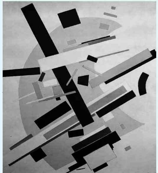
Kasimir Malevitch Suprématisme (1916)